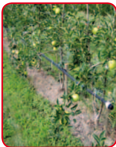
Frutteto NON cimato. NON pruned orchards. Vergers NON taillé. NICHT gestutzter Fruchtgarten.

Formazione della parete fruttifera con conseguenti vantaggi gestionali, agronomici e di sostenibilità senza uso di brachizzanti. Espaliered fruit trees grant managing, agronomic and sustainability advantages and exclude the use of plant growth regulators (PGR). Les arbres fruitiers en espalier offrent d'importants avantages agronomiques, de gestion et de soutenabilité en excluant l'usage de produits pour le contrôle de la croissance des plantes. Fruchtwandbildung, die wirtschaftliche agronomische Vorteile sowie eine sichere Nachhaltigkeit ohne Benutzung von Wachstumsregulatoren garantiert.