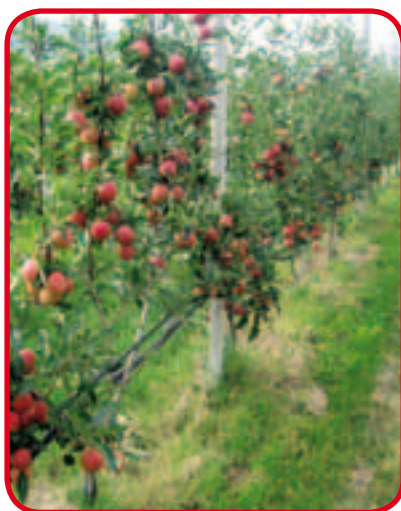
Frutteto cimato. Pruned orchards. Vergers taillé. Gestutzter Fruchtgarten.